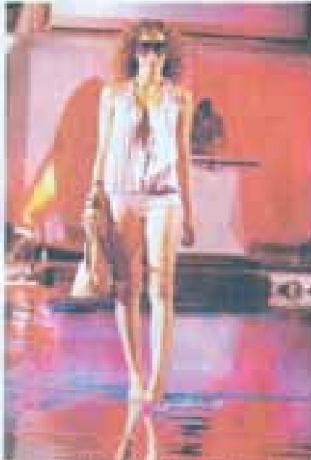
Modelos apresentando as últimas criações de estilistas belenenses durante o evento da Fashion de Belém em Belém.

Belém será o cenário, estilistas da capital organizaram evento no início do verão