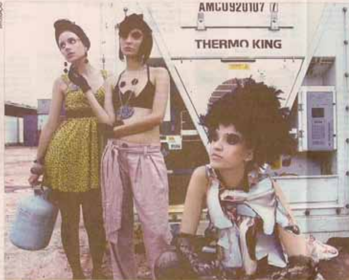
Modelos vestem roupas feitas com material alternativo pela Caixa de Criadores

Desde as edições anteriores, o Caixa de Criadores, além de projetar novas marcas no mercado local, procura conscientizar os profissionais de moda e design que estão começando na área. Na última edição, em dezembro, foram doados brinquedos para crianças da comunidade de Paracuri, em Icoaraci. Ações paralelas também são realizadas ao longo do ano, em busca da profissionalização de quem atua na área. Há dois meses, foi realizado um workshop com os estilistas que fazem parte dessa edição, sobre temas relacionados à criação, à pesquisa de infor-