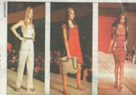
Três modelos mostram roupas criadas por alunas da Unama

NA PASSARELA Alunas do curso de moda fizeram sucesso com a coleção "Igaçaba"