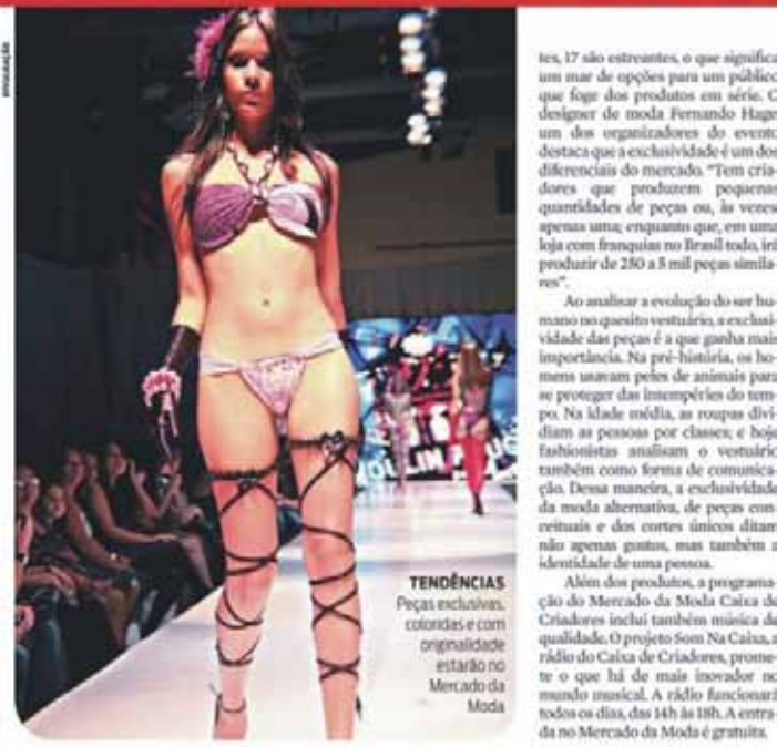
18 de Novembro de 2008, 09:20h | Fernando Feltre - A + A

R endas, bolinhas, bordados, paetês. Apesar da variedade de aplicativos que podem compor uma peça de roupa, a combinação ou não deles com a modelagem dá vida a elementos únicos. Singularidade que faz toda a diferença para quem gosta de estar em dia com as tendências da moda. Assim, são os produtos do Mercado da Moda Caixa de Criadores, que possuem do básico ao criado sem perder a elegância. As peças estarão disponíveis do dia 28 de novembro a 6 de dezembro (exceto no dia 30/11), no Espaço São José Liberto / Polo Jocalheiro, das 14h às 20h. O carro-chefe dessa edição é a novidade. Das 47 marcas participan-