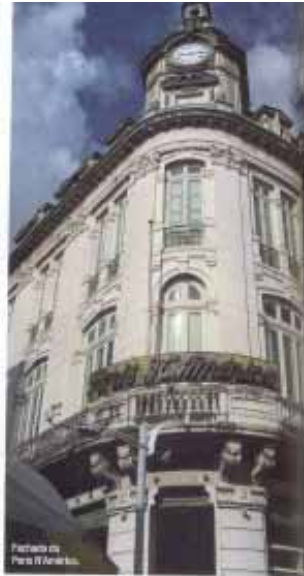
Façada de Paris em Belém.