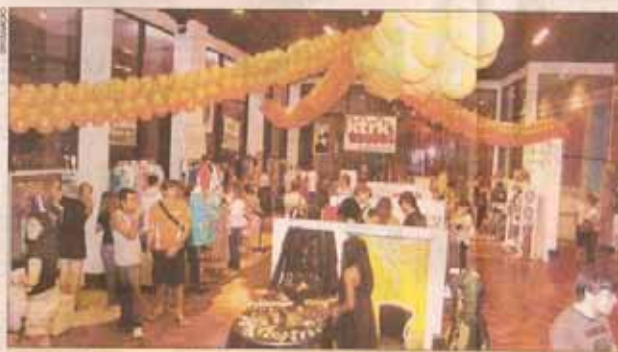
Aspecto do evento Mercado de Moda Caixa de Criadores, onde a moda está aliada à música