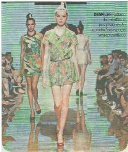
DESFILE Resultado do trabalho de pesquisa, criação e produção das peças será apresentado