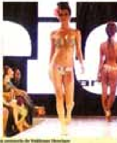
Um momento do desfile de moda no Espaço de Eventos

Na passarela, o desfile da coleção de 32 estilistas da nova geração