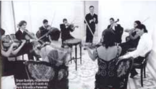
Orquestra Sinfônica do Estado do Pará em Belém.