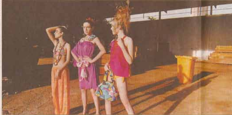
Modelos apresentam as diversas tendências da moda paraora em evento neste sábado