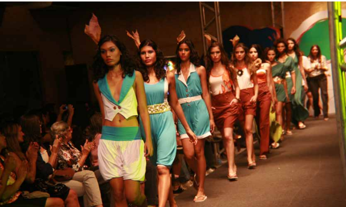
18 de Novembro de 2008, 09:20h | Fernando Feltre - A + A

Além dos produtos, a programação do Mercado da Moda Caixa de Criadores inclui também música de qualidade. O projeto Som Na Caixa, a rádio do Caixa de Criadores, promete o que há de mais inovador no mundo musical. A rádio funcionará todos os dias, das 14h às 18h. A entrada no Mercado da Moda é gratuita.