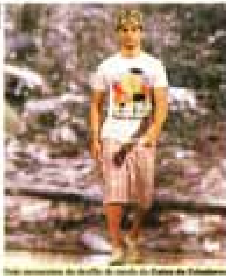
Um momento do desfile de moda no Espaço de Eventos

O Mercado de Moda Caixa de Criadores mostrou para todos as novidades e as tendências da moda e das cores. O evento, realizado no espaço São José Liberto, contou com a participação de 32 marcas participantes que aqueceram as compras de natal com produtos exclusivos e cheios de estilo. Durante toda a semana do evento foram arrecadados livros (novos e/ou usados) os quais foram doados para a Instituição Pia Nossa Senhora das Graças que atende jovens vítimas de abusos domésticos. Com consciência social o caixa fechou a temporada 2008 com chave de ouro.