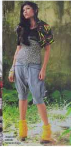
Estilo de vida em Belém.

departamento, nasceu entre 1800 e 1800 na França e na Inglaterra, era predominantemente de caráter europeu que refletiam o desejo pelo luxo, mas também o desejo de paços, eventos e celebrações. Na ocasião, várias opções de partituras foram ofertadas ao público. Como as famílias mais abastadas faziam seus sons, as set executada à prosa, automaticamente, dilata a legem nos melhores ambientes.